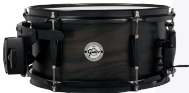
GRETSCH SERIES ASH