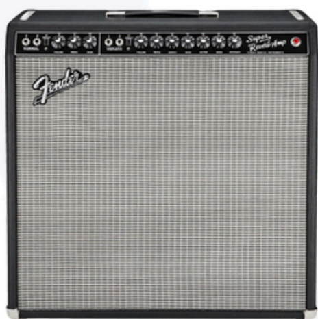
Fender 65 Super Reverb