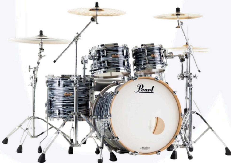
PEARL Master Maple reserve