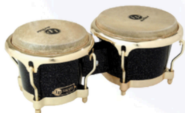
Bongo LP 794 Galaxie Giovani