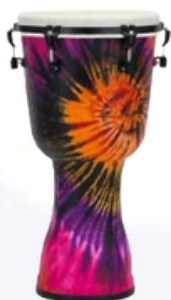
Pearl Purple Haze