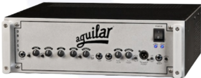
Aguilar DB 751