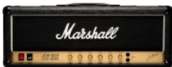
Marshall JCM 800 lead