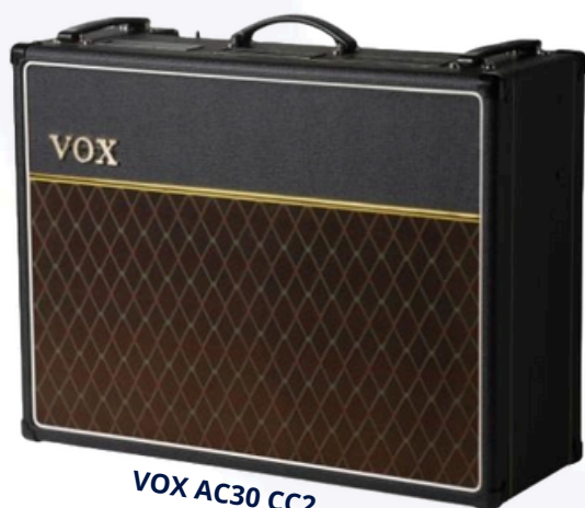
VOX AC30 CC2