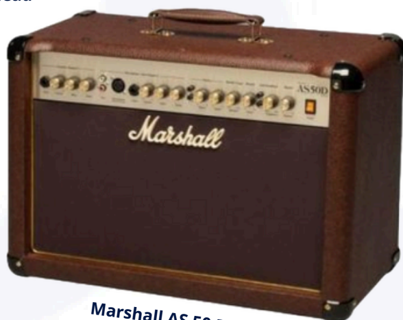
Marshall AS 50 D