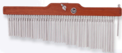
Chime LP 513