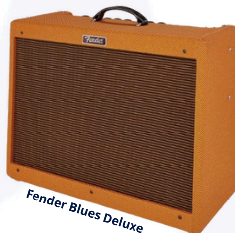
Fender Blues Deluxe