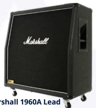
Marshall 1960A Lead