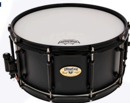
PEARL Ultra cast