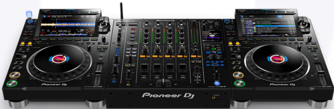
CDJ 3000 & DJM A9