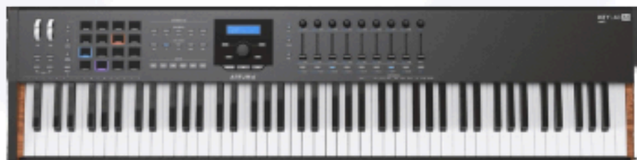
MK2 88 touches