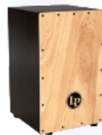
Cajon LP 14 32