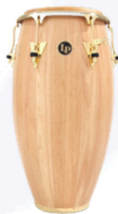
Congas LP ( Tumba)