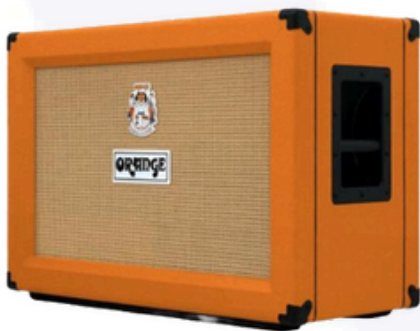
Orange PPC 212