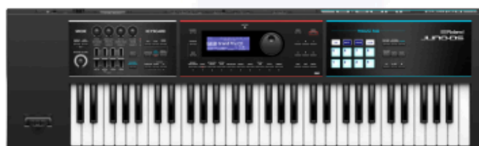
Roland Juno DS-61