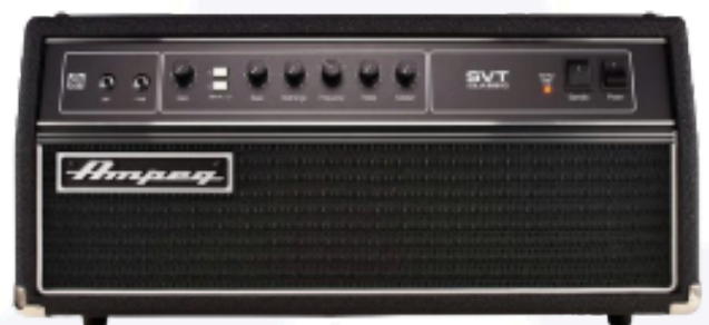
Ampeg SVT Classic