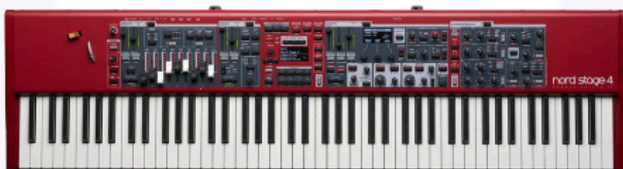
Nord stage 4